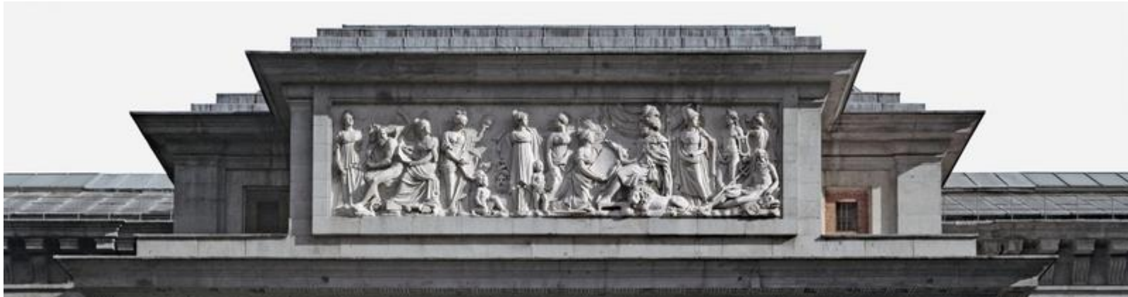
Museo del Prado. Fernando VII recibiendo los tributos de Minerva y las Bellas Artes , de Ramón Barba (s. XVIII). Friso en la fachada oeste del Edificio Villanueva del Museo del Prado (Madrid) (Todos los derechos reservados)