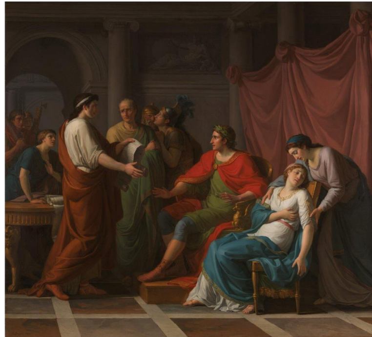
© The National Gallery. Virgilio leyendo la Eneida a Augusto y a Octavia (1787) , óleo sobre lienzo de Jean-Joseph Taillasson (CC BY-NC-ND)